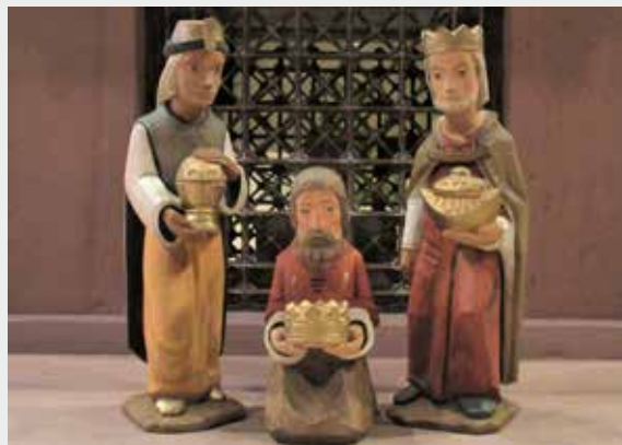
(Pfarrkirche Mariä Himmelfahrt Oestrich – „Hl. Drei Könige“)

Es besteht aber auch die Möglichkeit Ihre Spende bei den Türkollekten abzugeben, die wir in allen Kirchen des Pastoralverbundes abhalten werden.