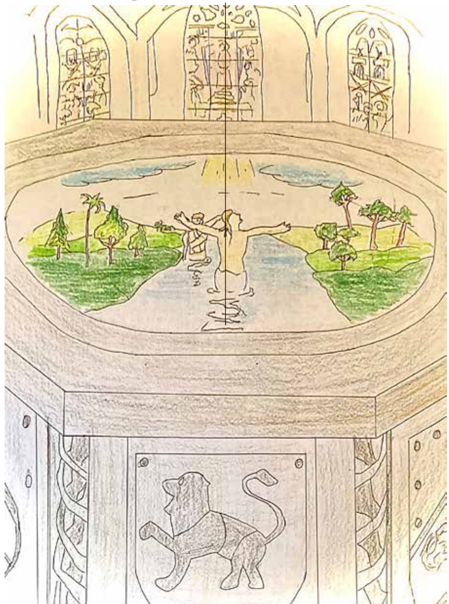
Das Bild hat Justus Röttgers gemalt. Es soll das Taufbecken aus der Herz Jesu Kirche darstellen mit der Taufszene darin von Jesus und Johannes der Täufer im Jordan. Im Hintergrund sollen das die drei Fenster hinter dem Hochaltar schematisch zeigen.

Was wird uns das Neue Jahr 2021 bringen? Wird es ein „gutes“ Jahr werden, in dem sich vielleicht ein Traum erfüllt? Eine Hoffnung, die „Hand und Fuß“ bekommt? Werden wir die Corona Pandemie in den Griff bekommen? Wieder zu früheren Lebensformen/Kontakten/Versammlungen/gemein-